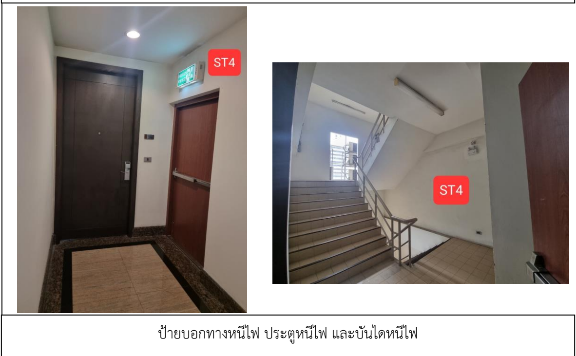
รูปที่ 2.4.6-1 อุปกรณ์ป้องกันอัคคีภัย อุปกรณ์แจ้งเหตุอัคคีภัย ป้ายบอกทางหนีไฟ ประตูและบันไดหนีไฟ